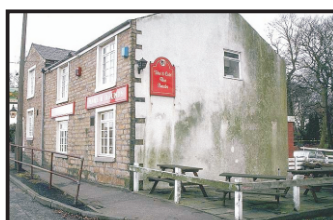
Fachada deteriorada por microrganismos