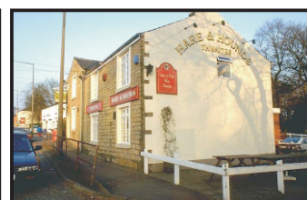
Fachada após limpeza com CleanWall